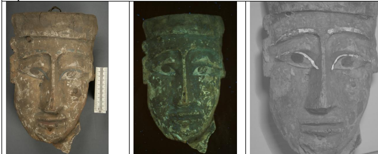
Átvételi állapot normál