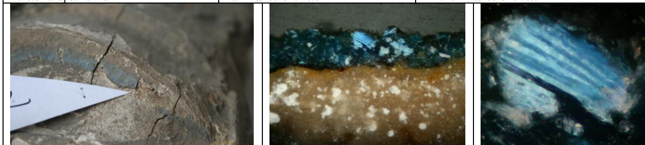
Mintavétel helye, késsel kihúzott szem felső része